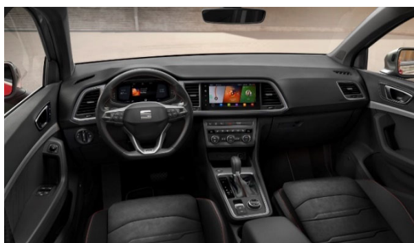
Digitální přístrojový štít s 10,25" barevným TFT displejem

Bezdotykové elektrické ovládání 5. dveří + Alarm