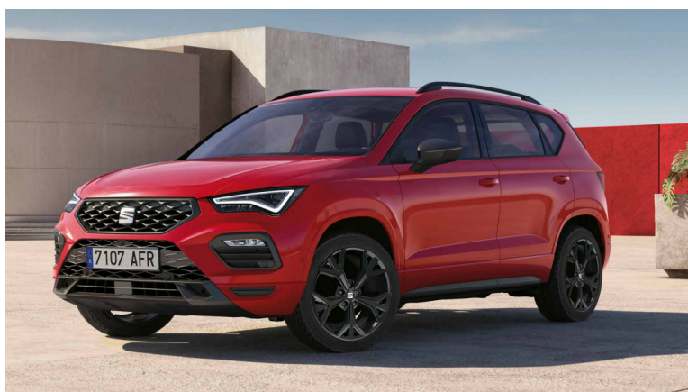
19" lesklá černá kola z lehkých slitin Exclusive IV

*Vůz již nelze objednat do výroby. K dispozici jsou pouze skladové vozy SEAT Ateca FR Black Edition.