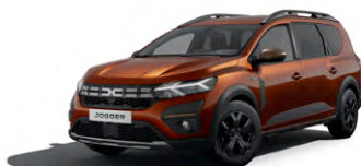
HNĚDÁ TERRACOTTA (1)