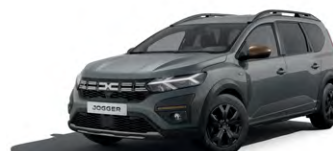
ŠEDÁ URBAN (2)