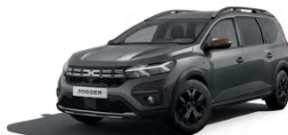
ŠEDÁ SCHISTE (1)