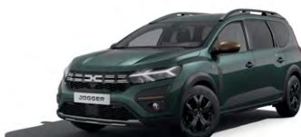
ZELENÁ CĚDRE (1)