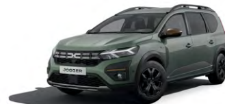
ZELENÁ DUSTY (2)