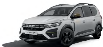
BÍLÁ GLACIER (2)