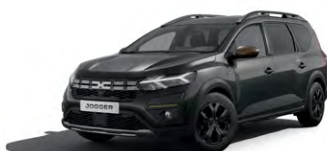
ČERNÁ NACRÉ (1)